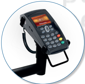
POS nicht UNbeaufsichtigt Seitlich befestigter Schwenkarm